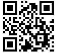
研討會報名 QR CODE

本會將於報名截止後以 E-mail 方式通知報名結果，若需要了解進一步的報名細節，請來電洽詢台灣性教育學會彭小姐（02-2933-5176）