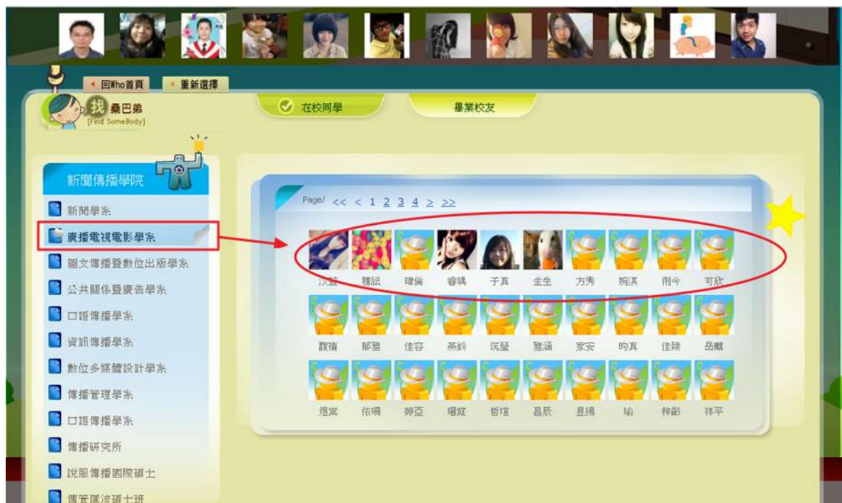
圖三 桑巴地搜尋-站台瀏覽