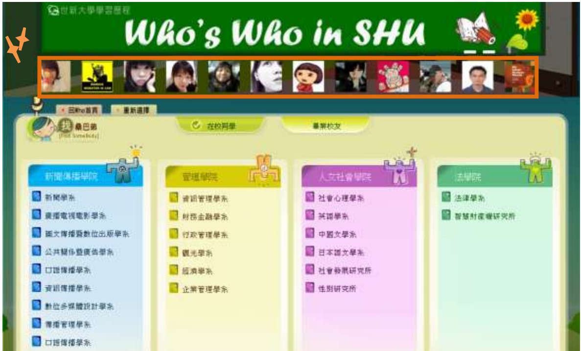
圖二 桑巴弟搜尋-選擇科系

5. 桑巴弟搜尋：圖一方框 2 內的綠色圓框中，點選「桑巴弟」則進入圖二之科系一覽表，上方可選擇在校同學或是畢業校友。選擇科系後就可直接瀏覽科系學生之站台(圖三)。本功能適用特定搜尋或是隨意瀏覽站台。