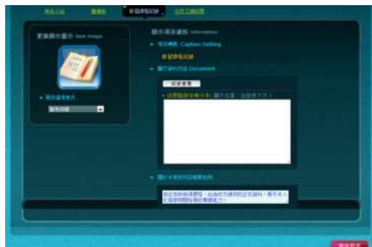
圖十二 修習課程紀錄