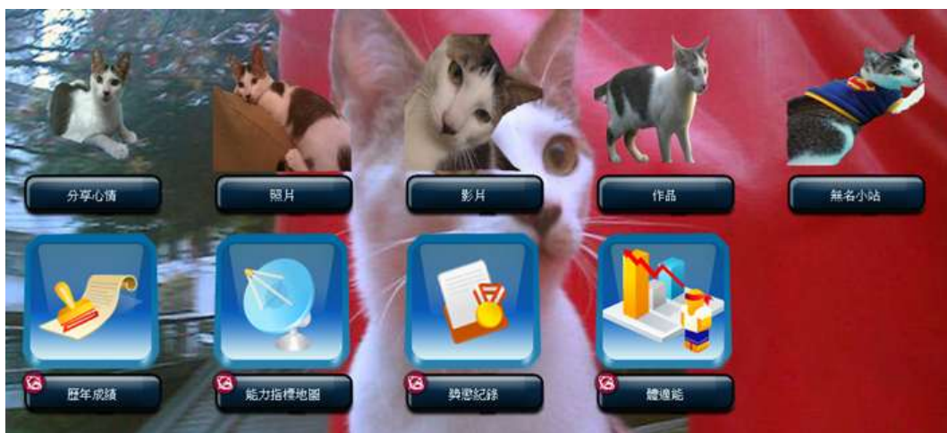
圖六 ePortfolio 顯示頁面