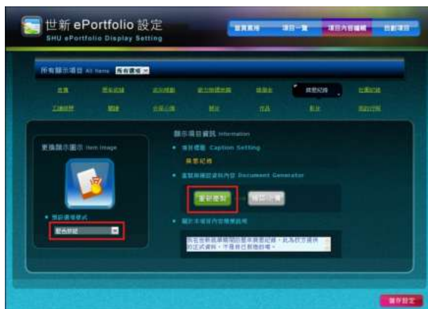
圖九 項目內容編輯-2