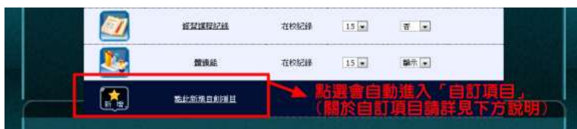
圖七 項目一覽新增自訂項目