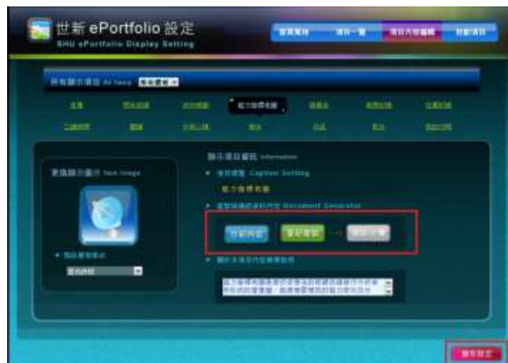
圖十 項目內容編輯-3

4. 在校工讀經歷及修習課程內容需自行編輯內容，可加入個人心得或看法使紀錄更加具獨特性或參考性。「紀錄查看」為跳出預覽視窗，內容顯現現階段之產製內容及心得內容。(圖十一、圖十二)