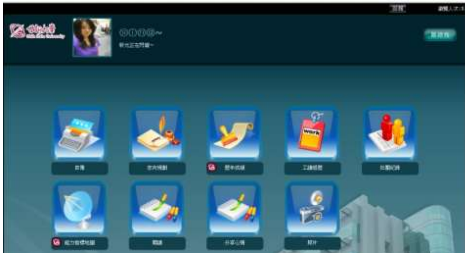
圖十四 ePortfolio 個人站台