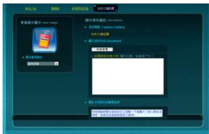
圖十一 在校工讀經歷

4. 在校工讀經歷及修習課程內容需自行編輯內容，可加入個人心得或看法使紀錄更加具獨特性或參考性。「紀錄查看」為跳出預覽視窗，內容顯現現階段之產製內容及心得內容。(圖十一、圖十二)