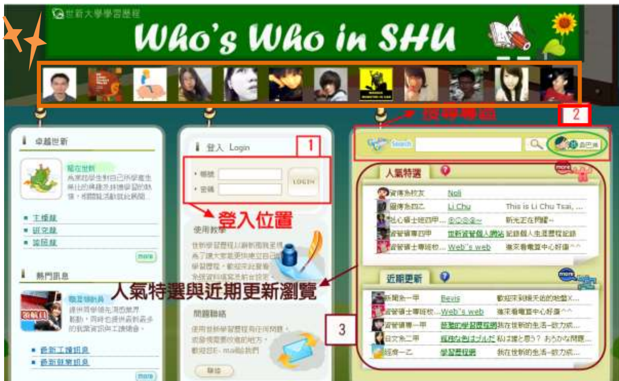
圖一 ePortfolio 登入主畫面