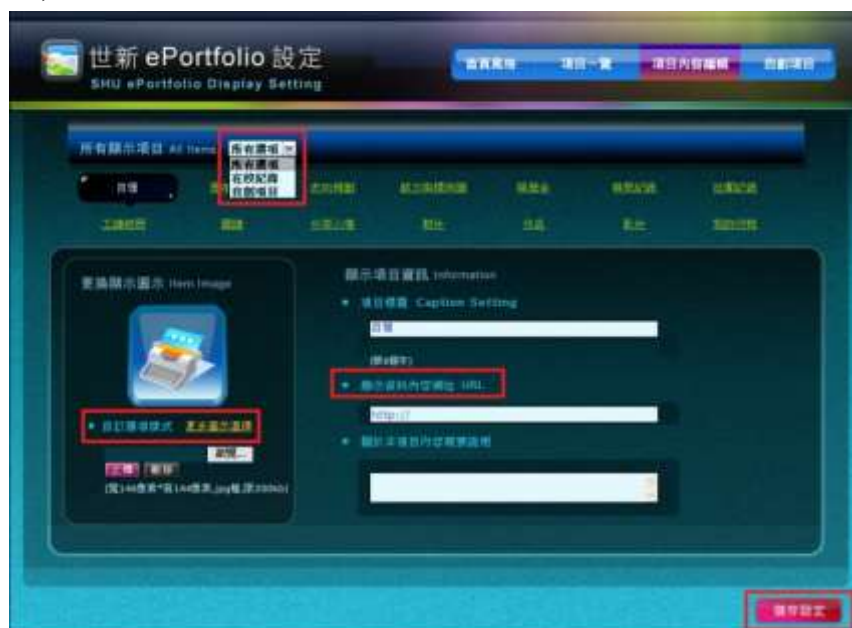
圖八 項目內容編輯-1